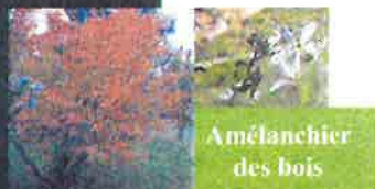
Amélanchier des bois