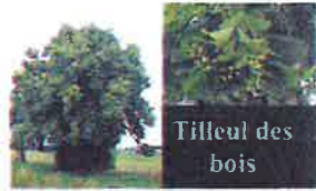
Tilleul des bois