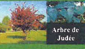
Arbre de Judée