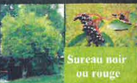
Sureau noir ou rouge